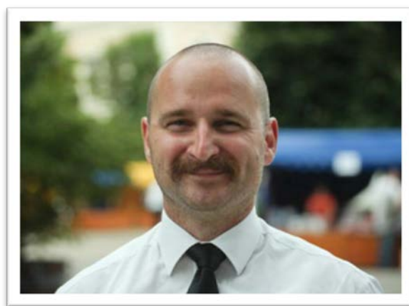
Szenn Péter püspök.

Munkádat kísérje az Isten óvó szeretete és a drávaszögi és szlavóniai magyar közösség beléd vetett bizalmának töretlensége.