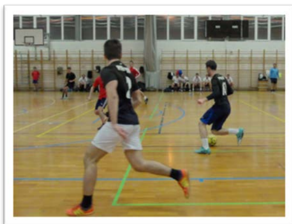
A Futsal Kupa egyik mérkőzése

A november 14-ről 15-re virradó éjszaka lett megrendezve az idei jótekonysági Kosztolányi Futsal Kupa a Pécsi Tudományegyetem Sportcsarnokában.